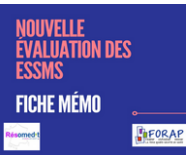
Tableau synthétique du RESOMEDIT

Pour s'approprier les attendus des critères d'évaluation en lien avec la PECM